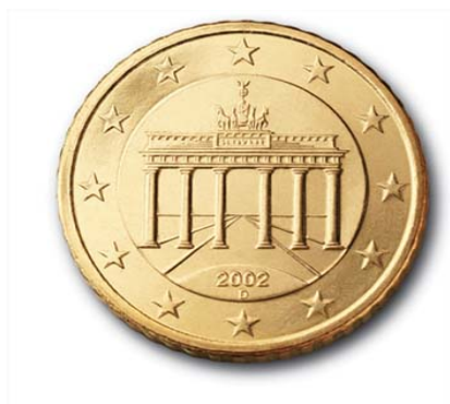
Motif de Reinhard Heinsdorff Pièces de 10, 20 et 50 cents

Entourée des douze étoiles de l'Europe, la Porte de Brandebourg est surmontée du quadrigue de la Victoire, char attelé à quatre chevaux de front. Six colonnes doriques supportent l'entablement. Elles ouvrent la porte vers un horizon où convergent les lignes de perspective, issues d'un soleil levant. La Porte de Brandebourg domine la célèbre avenue berlinoise Unter den Linden qui signifie « sous les tilleuls ».