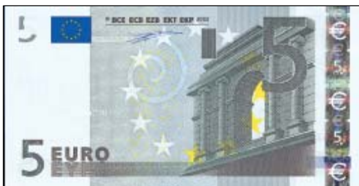
Billet de 5 Euros Motif de Robert Kalina

L'art antique se décompose en cinq ordres : toscan, dorique, ionique, corinthien et composite. Il prend naissance dans l'art grec et se perpétue dans l'art romain.